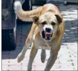
कई महिलाओं और बच्चों को काटकर किया घायल रात के समय तो हालात और भी हो जाते हैं भयावह हरिभूमि न्यूज ॥ रोहताक

बच्चों में डर: बच्चे अकेले बाहर जाने या खेलने से भी कतराने लगे, घरों में दुबकने को हो रहे मजबूर