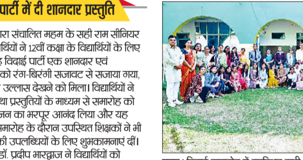
महम। विदाई समारोह में उपस्थित सही राम स्कूल के विद्यार्थी व शिक्षक।