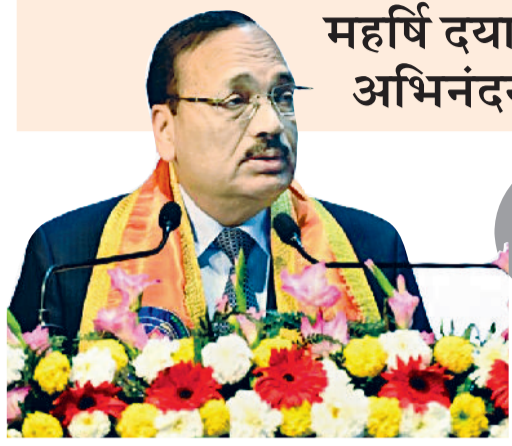
हरिभूमि न्यूज | रोहतक

मेरे करियर की शुरुआत एमडीयू यूनिवर्सिटी से हुई। मुझे इस बात की बहुत ही प्रसन्नता है कि मैं आज इस यूनिवर्सिटी में भारत का मुख्य न्यायाधीश बनने के बाद आ पाया हूँ और कुछ पुरानी यादें यहां ताजा कर पाया हूँ। ऐसा कहना है भारत के मुख्य न्यायाधीश (सीजेआई) जस्टिस सूर्यकांत का। उन्होंने शनिवार को महर्षि दयानंद विश्वविद्यालय में स्वर्ण जयंती एवं एलुमनाई अभिनंदन समारोह में मुख्य अतिथि के रूप में शिरकत की। उन्होंने कहा कि इस पद तक पहुंचना अपने आप में एक संघर्ष था। उन्होंने कहा कि जीवन में सफलता के लिए स्पष्ट लक्ष्य निर्धारण, कड़ी मेहनत, अनुशासन और लक्ष्य प्राप्ति की दृढ़ इच्छाशक्ति आवश्यक है। उन्होंने कहा यह हरियाणा के लिए ही नहीं, मैं पूरे भारतवर्ष के हर युवा को आह्वान करूंगा कि अपनी क्षमता पर वो भरोसा करे, मेहनत करे, लगन और ईमानदारी से काम करे। चाहे वह न्यायपालिका में है, राजनीति में है, सिविल सर्विसेज में है, किसी भी प्रोफेशन में है, वह अपने उच्चतम पदों तक अपना नाम कमाए। उन्होंने कहा कि आप देखिए जितने मुकदमे इस देश में बढ़ते जाते हैं हर साल, वो अपने आप में इस बात का बहुत बड़ा सबूत है कि भारतीय जनता को न्याय प्रणाली पर बहुत ज्यादा विश्वास है। सीजेआई ने बताया कि सुप्रीम कोर्ट का नया कॉम्प्लेक्स तैयार किया जा रहा है। इसका पहला चरण इसी वर्ष पूरा होने की उम्मीद है, जबकि बाकी दो चरण बाद में पूरे होंगे।